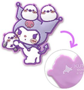
■ラバーマグネット 660円