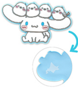
■ラバーマグネット 660円