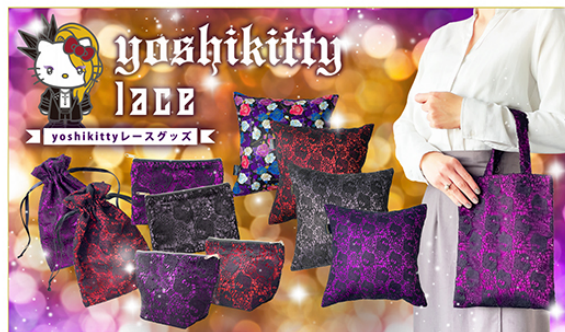
© 2022 SANRIO CO., LTD. APPROVAL NO.L630057 © 2022 Japan Music Agency Co., Ltd.

この度、株式会社あすなろ舎(本社：神奈川県大和市、代表取締役社長：石川浩三)は、株式会社サンリオ(※以下サンリオ)の「ハローキティ」とYOSHIKIのコラボレーションキャラクター「yoshikitty」のグッズを集めた専門サイト『yoshikitty Online Shop』を、4月8日(金)11:00よりオープンいたします。