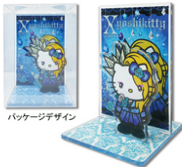
パッケージデザイン